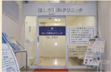
はしだ眼科クリニック