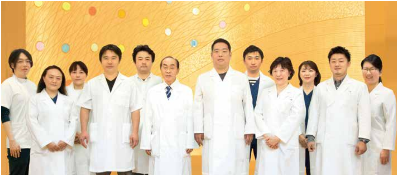
西葛西・井上眼科病院は、常勤、非常勤合わせて30名以上の医師が勤務しています。今回お写真にご登場いただいたのは、常勤医師として日々診療を行っている12人の医師です。

西葛西・井上眼科病院は、一般眼科外来や各種専門眼科外来、白内障や網膜硝子体の手術も行う眼科専門病院です。白内障手術をはじめ、網膜硝子体手術や眼瞼(まぶた)の手術など年間4,900件を超える手術を行っています。