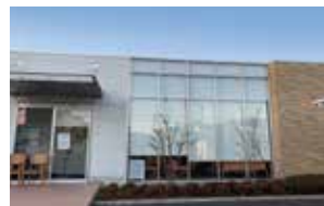
いずみ眼科クリニック外観