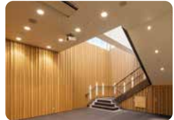
地下1階 多目的ホール

セミナーは、質疑応答を含め40分前後の予定です。セミナー後、検査室や手術室をご覧いただける「院内見学会」を行いますので、ご自由にご参加ください。 セミナーは随時開催予定です。スケジュールは変更になる場合もございます。最新のスケジュールはホームページをご確認ください。