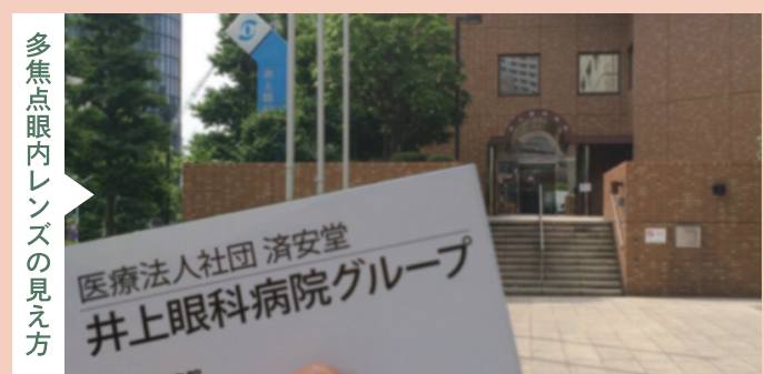
多焦点眼内レンズの見え方