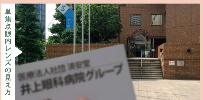
単焦点眼内レンズの見え方

当院では、以下の種類の眼内レンズを取り扱っています。種類によって見え方には違いが出ます。