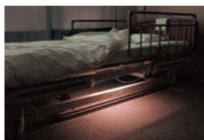
安眠・安全に配慮し、常夜灯はベッド下の足元灯。