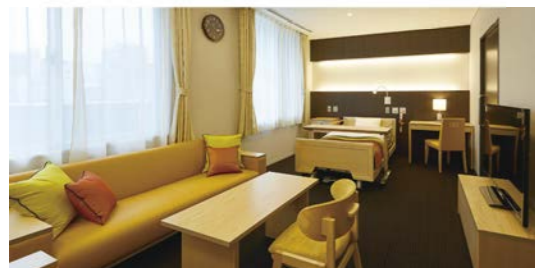
特別室には、バス、ミニキッチンのほか、広い応接セットも。家族や面会者の励ましが重要になる長期入院に配慮した。