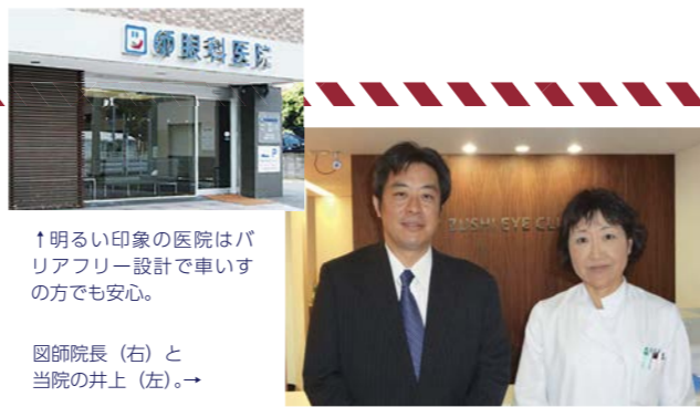
↑明るい印象の医院はバリアフリー設計で車いすの方でも安心。