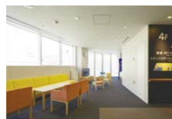
明るい雰囲気のあるデイルーム