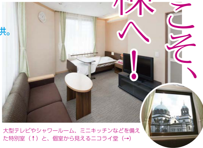
大型テレビやシャワールーム、ミニキッチンなどを備えた特別室（↑）と、個室から見えるニコライ堂（→）

さらに、デイルームに拡大読書器を設置したり、全職員が誘導や食事介助の訓練を受けるなど、ロービジョンの患者さまでも安心して過ごしていただけるような眼科特有のホスピタリティの向上を目指している。