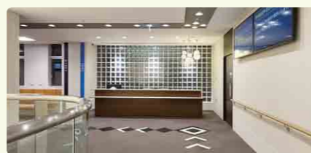
ライン照明と床のビニールタイル

天井のライン照明が床のビニールタイルに反射し、方向性を示します。凹凸のない床は、杖や車椅子、ベビーカー利用者にも使いやすくなります。