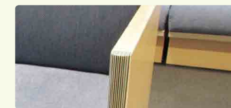
視認性を高めたエッジ

通常の約2倍サイズのボタンをエレベーターに設置。待合のソファなどは端の部分(エッジ)を強調し、視認性を高めました。