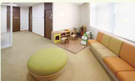
小児眼科外来 待合スペース

2Fの小児専用スペースで検査から診察までを行います。お子さまもご家族も安心して過ごせるよう、さまざまな工夫をしています。