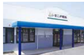
ブルーが印象的な外観。