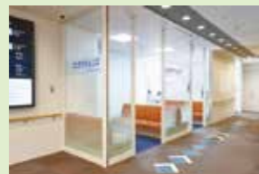
西葛西・井上眼科病院 コンタクトレンズ外来

最近では、コンタクトレンズがインターネットでも購入できるようになり、眼科で検査を受けずに、ネットの情報だけで購入しトラブルになるケースも増えています。コンタクトレンズは、「高度管理医療機器」であり、適切な管理が必要な医療機器に指定されています。使用の際には、眼科医の診断と、定期的な検査を受けることをお勧めいたします。